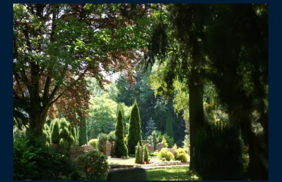
Impressionen vom Parkfriedhof „Deisterstraße“

Urnengräber für 2 Urnen. Anlage u. Pflege der Grabstätten erfolgt ausschließlich durch die Friedhofsgärtnerei der Stadt Hameln und ist für 20 Jahre im Kaufpreis enthalten. Eine Ablage von Blumenschmuck ist nur an den zentralen Plätzen und nicht auf der Grabstätte selbst möglich. Das Auflegen einer liegenden Platte als Grabmal ist zulässig.