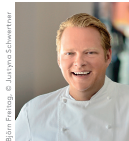
Björn Freitag

Gemeinsam mit Sterne-Koch Björn Freitag zeigt die Klimaschutzagentur Weserbergland, wie einfach klimafreundliches Kochen ist. Verschiedene vegetarische Gerichte und schmackhafte Leckerbissen mit hauptsächlich regionalen und saisonalen Produkten aus dem Weserbergland werden live zubereitet