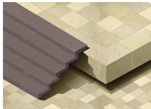
Detail Bronzetrepppe Bühne