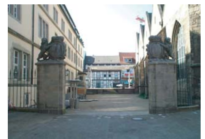
Lüttjer Markt Bestand