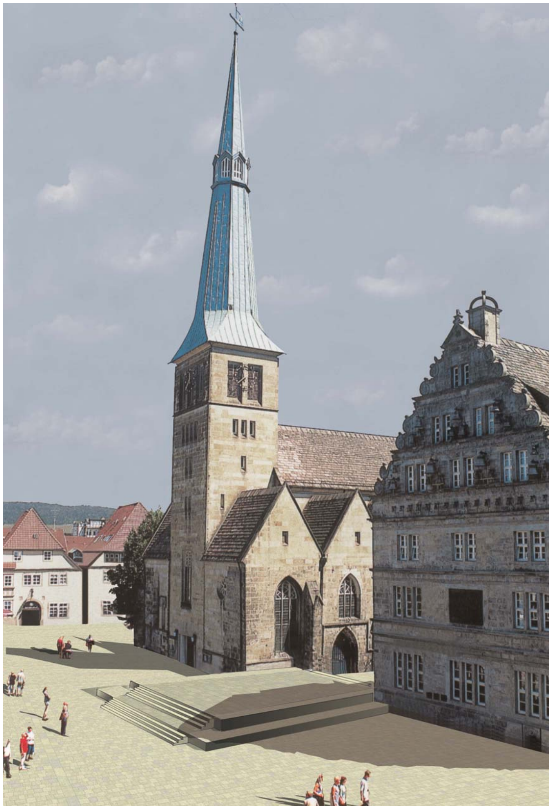
Variante 2 mit Bronzetreppe