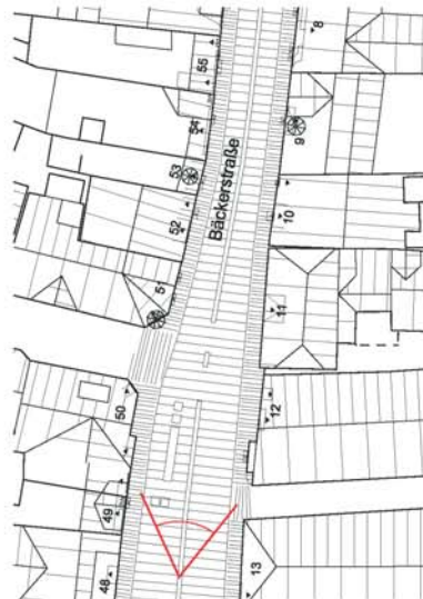
Perspektive Blick in die Bäckerstrasse