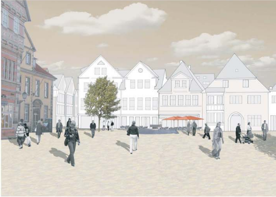
Perspektive Blick auf den Markt / Pferdemarkt