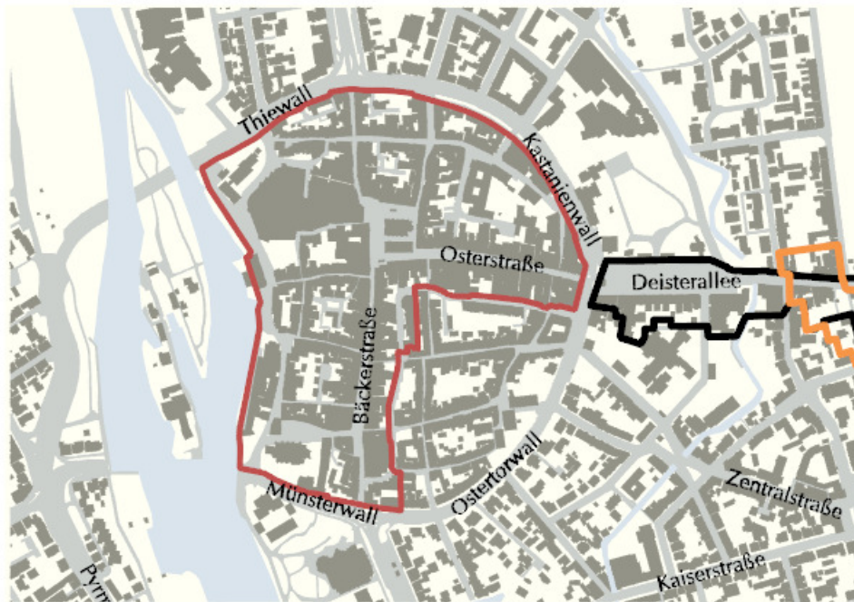
Abbildung des Hauptgeschäftsbereichs Altstadt.

Die Altstadt Hamelns wird ungefähr zu drei Vierteln ihrer Fläche als Hauptgeschäftsbereich definiert. Der südöstliche Bereich wurde nicht als Bestandteil des zentralen Versorgungsbereiches definiert da hier die funktionale Dichte der versorgungsrelevanten Nutzungen deutlich gegenüber den übrigen Bereichen der Altstadt abnimmt. Dabei handelt es sich um eine historisch gewachsene Situation, die aus städtebaulicher Sicht auch nicht verändert werden soll. Der Haupteinkaufsbereich des zentralen Versorgungsbereiches Altstadt befindet sich entlang der Straßenzüge Bäckerstraße, am Markt, Pferdemarkt, Osterstraße, Ritterstraße und Emmernstraße sowie einigen Nebenstraßen.